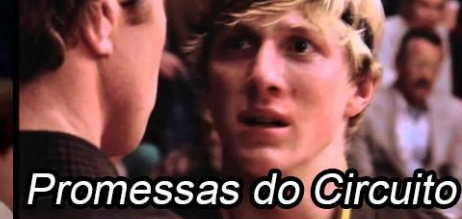
Promessas do Circuito