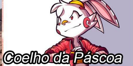
Coelho da Páscoa