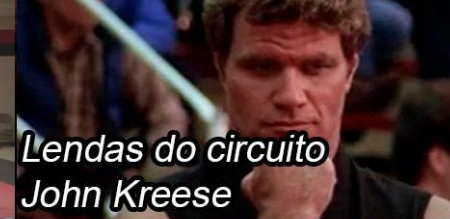
Lendas do circuito John Kreese