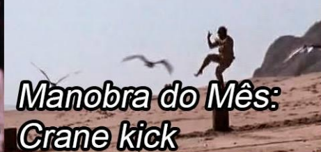
Manobra do Mês: Crane kick