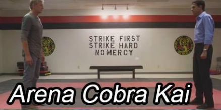
Arena Cobra Kai